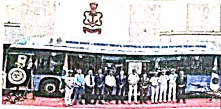
एक समझौता ज्ञापन (एमओयू) पर हस्ताक्षर किया गया। यह एक ऐतिहासिक क्षण था।

एक, पर्यावरण-अनुकूल बढ़ावा देने की दिशा में उभरे हुए, भारतीय आधुनिक हरित हाइड्रोजन पी है। हेवी-ड्यूटी ई-हाइड्रोजन ईंधन सेल में अग्रणी बनने के लिए भारतीय नौसेना के बीच